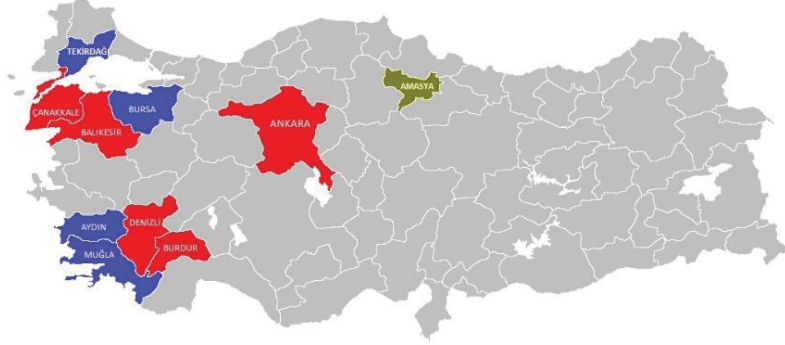
Şekil 1. Proje bölgeleri

da kararların daha çok sahiplenilmesine ve uygulamanın etkinliğine yansımaktadır.